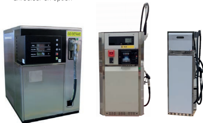
AVIDYS 540 Ravitaillement port