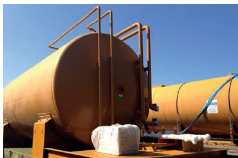
Version plateforme SIMPLIFIEE avec tôle-larmée