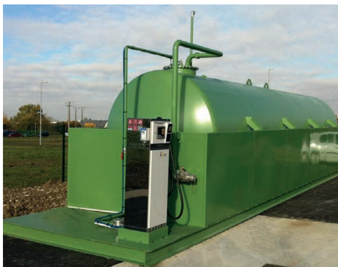
ECOTANK simple paroi sur SKID complet avec plateforme