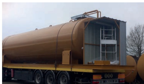
Abri protection pluie 3 faces