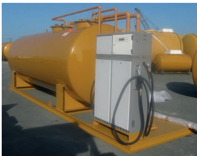
ECOTANK double paroi sur SKID complet avec plateforme

Ce matériel est susceptible de recevoir des composants ATEX ; en conséquence, les installateurs doivent travailler conformément à la directive 1999/92/CE.