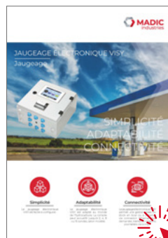
Jaugeage électronique Visy