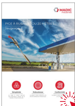
Pige ruban 10 ou 20 mètres

Cliquez sur la fiche produit de votre choix !