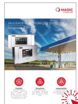
Jaugeage électronique EVO™