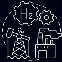
Source d'H 2