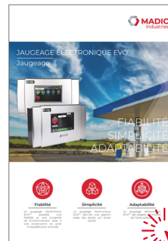
Jaugeage électronique EVO™