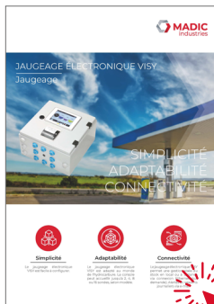
Jaugeage électronique Visy