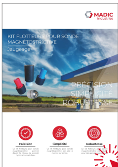
Kit flotteurs sonde magnétostrictive

Cliquez sur la fiche produit de votre choix !